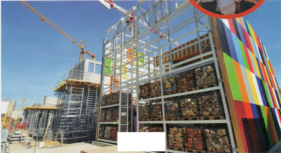
La structure TRANS305, et sa plateforme d'observation, se déplacera au fur et à mesure de l'avancée du chantier.

« REGARDEZ LA GRUE ! Vous voyez ce qu'elle transporte ? Cela pèse au moins cinq tonnes ! Comment aurait-on pu déplacer les palettes sans cet engin ? » Dans la symphonie bruyante des marteaux-piqueurs, des bétonnières et des cris d'ouvriers, les enfants du CM2 A de l'école Makarenko voisine en prennent plein les yeux et les oreilles. Perchés à 8 mètres du sol, au beau milieu du chantier de la Zac du Plateau, ils sont venus comprendre comment leur quartier se transforme. A gauche, les échafaudages s'entremêlent autour de la future annexe du ministère du Budget. A droite, s'étale l'immense terrain vague dans lequel des immeubles d'habitation prendront racine d'ici deux ans. Depuis 2006, le plasticien Stefan Shankland collabore avec le service urbanisme de la Ville sur le projet d'aménagement de l'ancienne RN 305. « Mon objectif est de rendre le chantier accessible au public. La poussière, les grosses machines, le bruit... Les travaux ça énerve