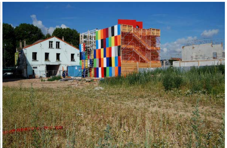
Atelier Trans305