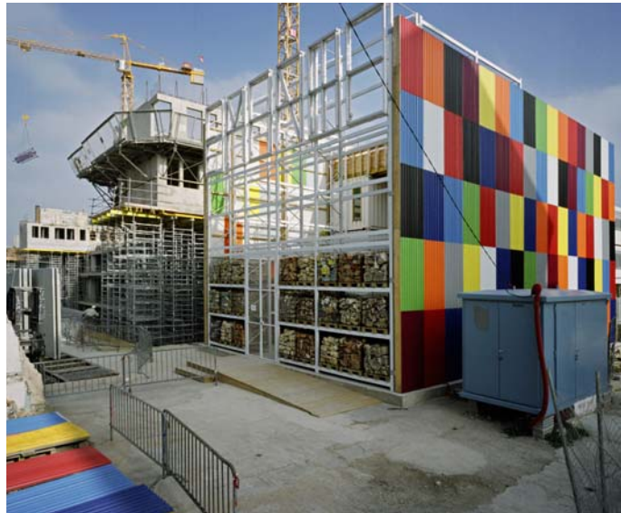
TRANS305, Sylvain Duffard