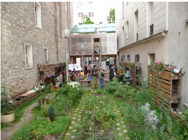
56 rue Saint-Blaise

Document préparatoire au voyage d'étude à Paris et à Ivry-sur-Seine le 31 mars 2011